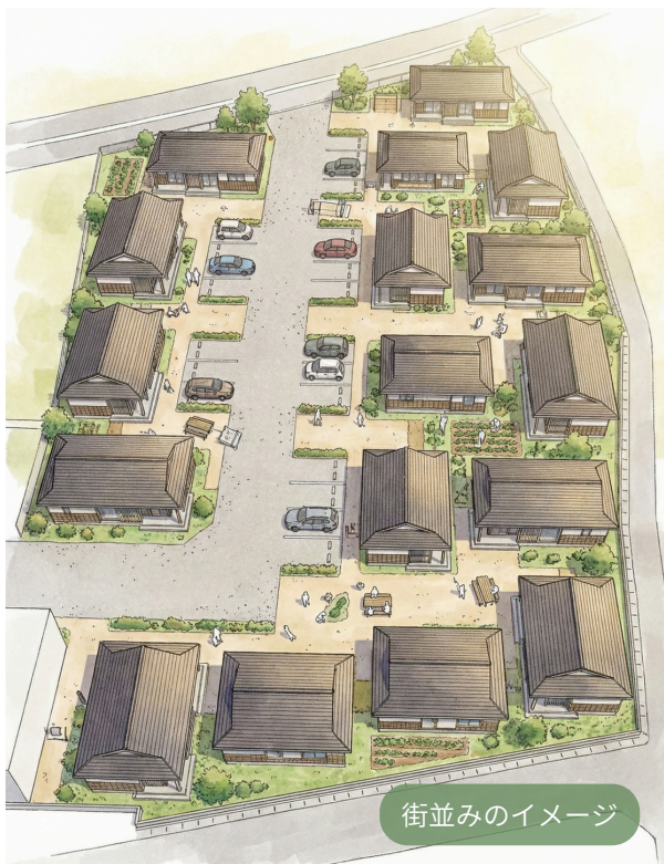
街並みのイメージ