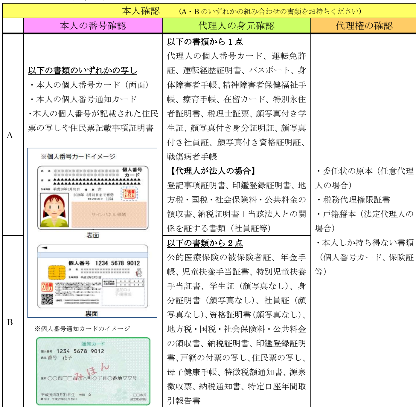
表3…eLTAXで申告書等を提出する場合