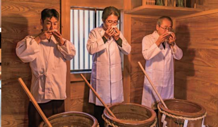
新酒の製造量やアルコール度数などを確認する「どぶろく検定」