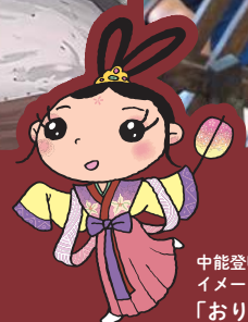
中能登町 イメージキャラクター 「おりひめ」