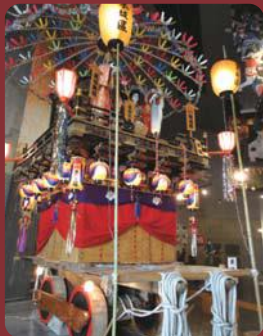
中能登町の曳山(ふるさと創健館)