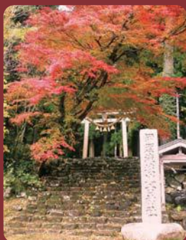
伊須流岐比古神社