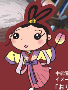
中能登町 イメージキャラクター 「おりひめ」