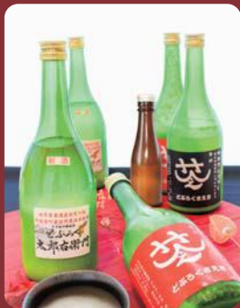
中能登町のどぶろく