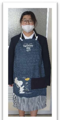
着物リメイク会の皆さん、 ありがとうございました。