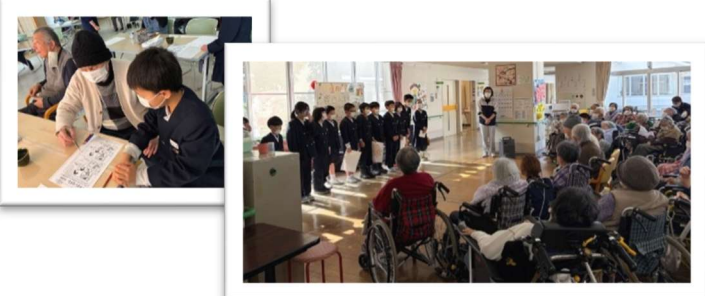
鹿寿苑の皆さん、ありがとうございました。

「だれもが住みよい中能登町」がテーマの学習。実際に高齢者の方と関わることで気にかけること、どのような遊びなら一緒に楽しくできるのかということを考えながら、ゲームや歌を企画し、高齢者の皆さんとの交流を深めてきました。