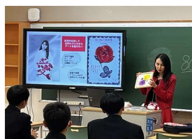
ラジオパーソナリティー