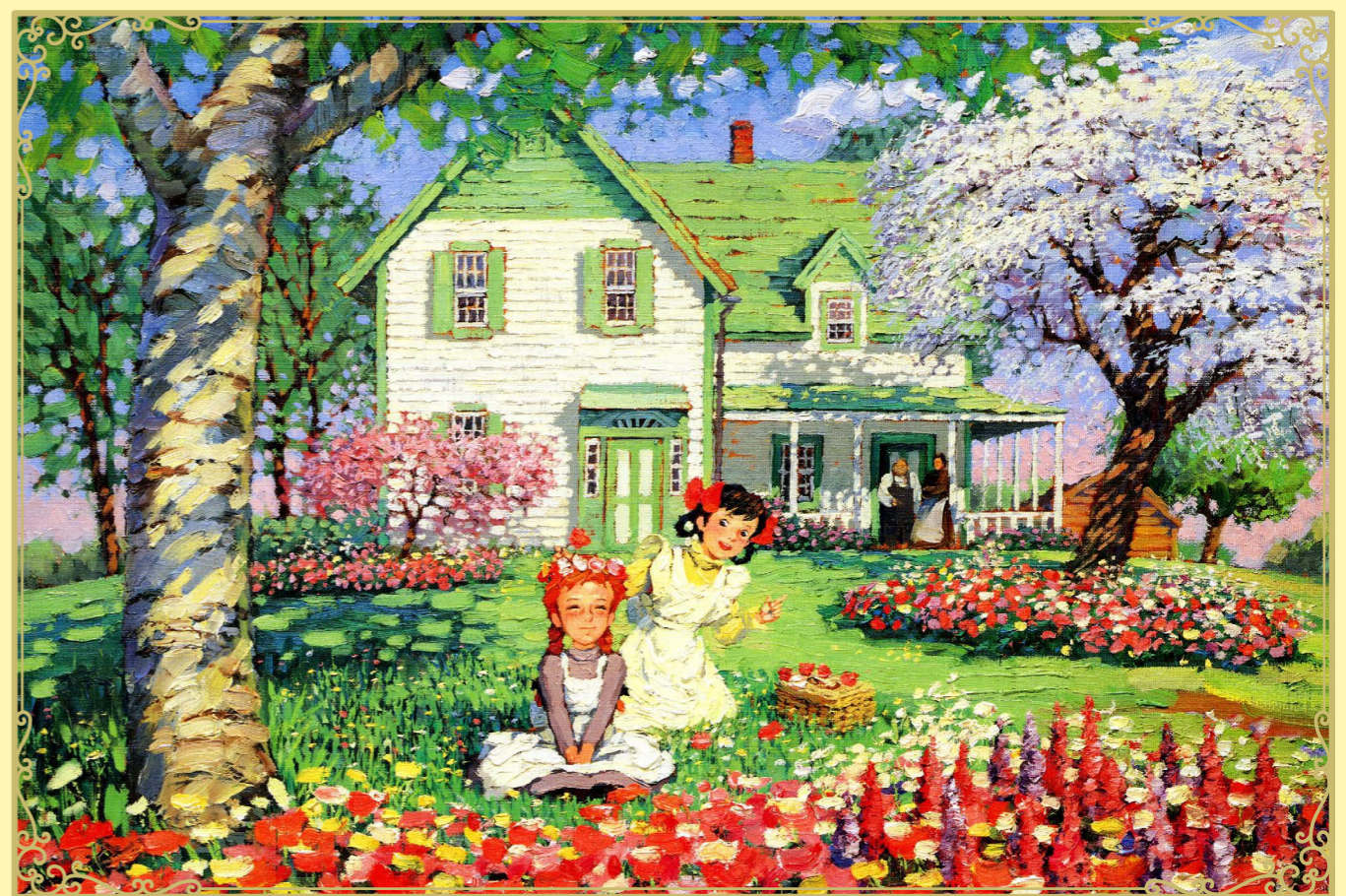
© NIPPON ANIMATION CO., LTD. "Anne of Green Gables" TM/AGLTA

あたたかな家庭を心から願ったアンは、マジュウとマリラに出会い、二人の愛情に包まれながら、自分らしく豊かで幸せな人生を歩みます。