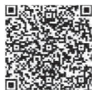
こども家庭センターホームページ

※各種事業で専門スタッフが不在となる場合があります。専門職員への相談ご希望の場合は事前にご連絡をお願いします。詳細については、こども家庭センターだより(HPに掲載)をご参照ください。