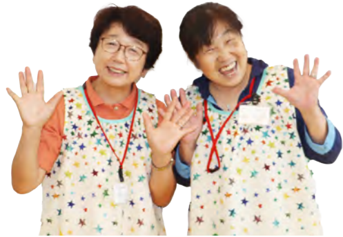
母子保健推進員（仲間募集中！）

母子保健推進員はどんな役割をしていますか。 私たちは、お母さんの休み時間の託児やEYEで見守りなどを行っています。見守りと言っても、一緒に遊んでいるというか、遊んでもらっている感覚です！ alkuはどんな場所ですか。 安心できる空間だと思います。お子様たちと一緒に遊びながら、親御さんたちと一緒に成長を見守って喜ぶ、そんな場所です。 子育て世代へ一言お願いします。 子育ては大変だけれども、一瞬しかないこの成長を見られるかけがえのないものです。推進員も一緒に見守り、喜びを分かち合えればと思っています。とにかく無理はしない事です！EYEや子育て支援センターの環境は年々良くなっており、お母さんだけでなくお父さんの利用も増えました。こういった施設や相談窓口、支援制度などをどんどん利用して欲しいと思います。