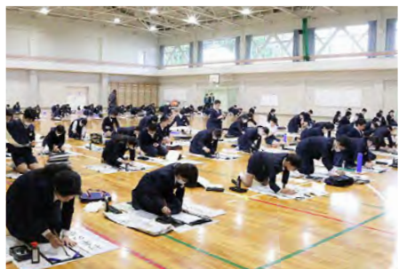
▲ 鹿島小学校書き初め大会の様子