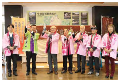
▲ セレモニーの様子

1月16日には全国のどぶろくが中能登町に集結し、競い合う、「全国どぶろく研究大会」が開催される予定で、大会の成功を祈る声も聞かれました。