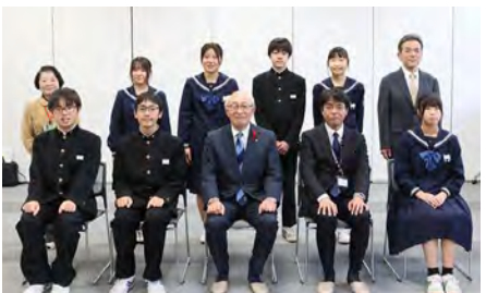
▲ 表彰された皆さん