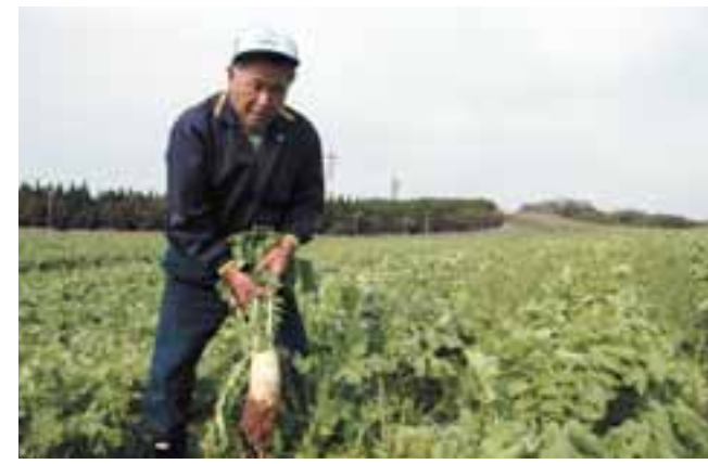
煮崩れしにくいので、主におでんの具として使われる源助大根。

収穫の秋到来! 春から夏に植え付けられた作物がたわわに実り、いよいよ収穫の秋到来です。新鮮で、おいしいものが多いばい食卓に並ぶのが楽しみです。