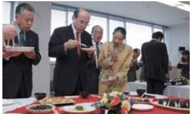
町内産の野菜中心ヘルシー料理で昼食会。