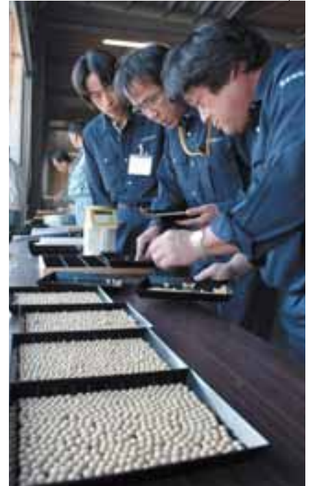
エンレイ種の大豆は、見た目がきれいな白い豆なので、煮物などに向いています。

収穫の秋到来! 春から夏に植え付けられた作物がたわわに実り、いよいよ収穫の秋到来です。新鮮で、おいしいものが多いばい食卓に並ぶのが楽しみです。