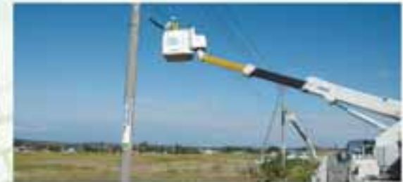
光ファイバー設置工事の様子