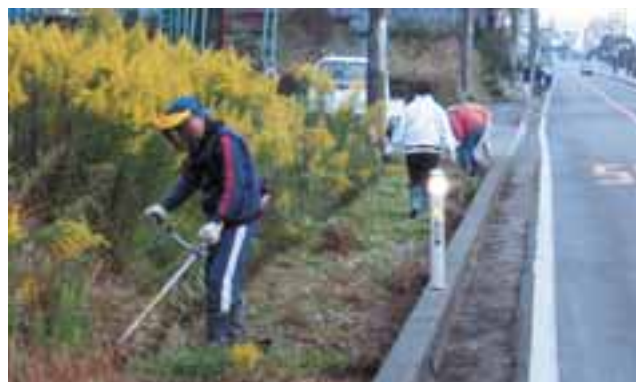
きれいな町づくりにご協力ありがとうございました。