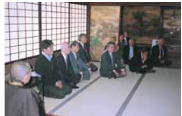
明正天皇旧殿の国重要文化財の書院内