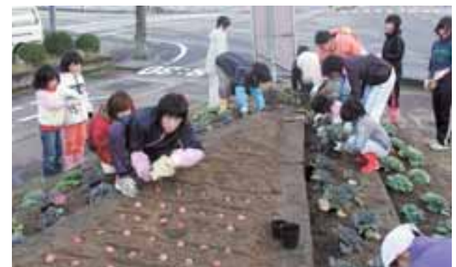
花壇を作り、花を大切にすることを養いましょう。

環境美化・緑化を推進するため、10月23日、秋のクリーン&グリーンデーが行われました。早朝にもかかわらず、大勢の人が参加し町中がきれいになりました。また、花があふれる町を目指し『花いっぱい運動』も行われ、約6,000本の葉牡丹やチューリップの球根が交差点や道路脇に植えられました。