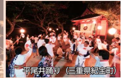
平尾井踊り (三重県紀宝町)