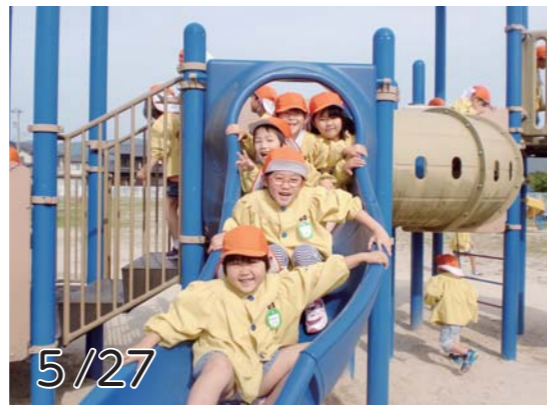
5/27 みんなすべり台大好き。順番守って仲良く遊びます