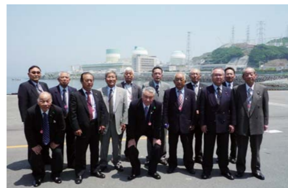
↑伊方原子力発電所にて

2日目は、午前中、伊方原子力発電所を視察。佐田岬半島にあり、救急患者に選んでは、船で九州の病院の方が短時間という地域にあります。現在は、勿論、発電停止中でしたが、再稼働に向けて大規模な安全対策を実施中でした。例えば、防潮堤は、最大の津波予想、満潮時で海抜4・3mに対して防潮堤は海抜10m(志賀発電所は津波予想5mに対し防潮堤15m)、電源確保として大容量電源装置及び電源車の配備がされていました。また、伊方原発独自の対策を含む新基準対策29項目中26項目が完了済みで、残り3項目が27年度に完了予定で、安全優先で再稼働に向け