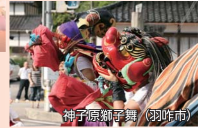
神子原獅子舞 (羽咋市)