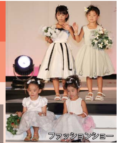
ファッションショー