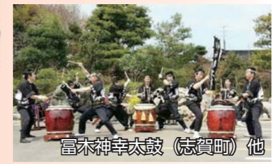
富木神幸太鼓 (志賀町) 他