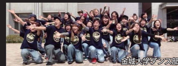
金城大学ダンス部