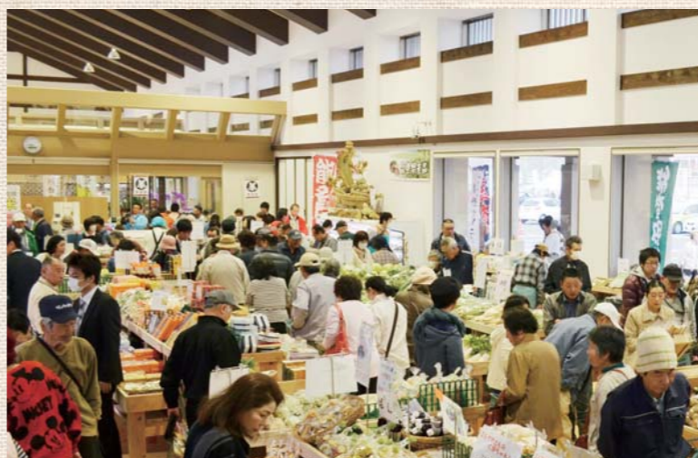
↑たくさんの人で賑わう織姫市場

4月17日のオープン以来、県内にとどまらず、県外からもたくさんの方が訪れ賑わいをみせている「道の駅 織姫の里なかのど」は、町のランドマークのひとつと言える。みなさんも道の駅に行つて、敷地内を探検してみてください。