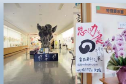
百海善市郎個展「思いは力なり展」が行われた（4月28日～5月15日、ふるさと創修館）