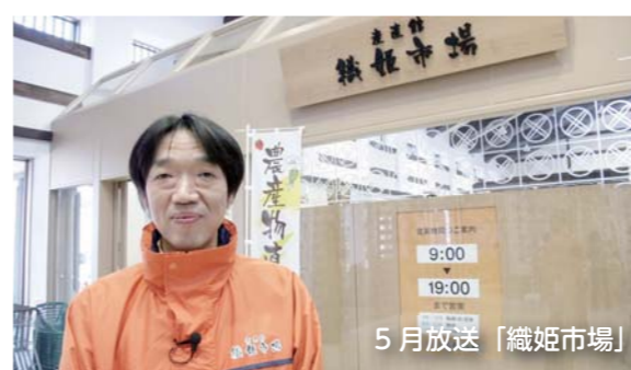
5月放送「織姫市場」 6月は「ドコモショップ鹿島店」です。

このコーナーにプレゼントを提供して下さる事業者を募集しています。コーナーの中でお店の紹介もできません。プレゼントを提供していただける事業者のかたは情報推進課へご連絡ください。