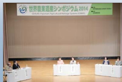
世界農業遺産シンポジウム2014で講演会とパネルディスカッションが行われた（4月19日、ラピア鹿島）