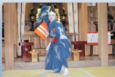
能登比咩神社で三番叟が奉納された（4月20日、能登部下）