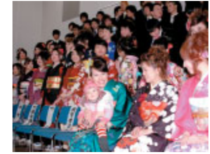
子育て中のママも出席。晴れ着姿のきれいなママと一緒に記念撮影