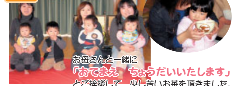
お母さんと一緒に「おてまえ ちようだいいたします」とぞ挨拶して、少し苦いお茶を頂きました。