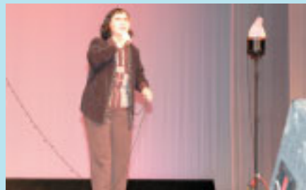
▲ 文化協会鹿島支部主催の歳末助け合いチャリティカラオケ歌祭りが、12月23日、ラピア鹿島で開かれ、集まった52,725円を教育資金としてご寄付いただきました。