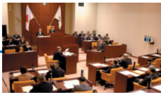
町政に関する様々な問題が話し合われました