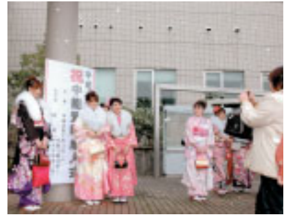
懐かしい同級生との再会を喜び合い、晴れ着姿で記念撮影。雪がちらつく会場の外でも「パチリ！」

母より 成人おめでとう！いつも笑って生きていますか？母は中年真っ只中ですが、それなりに楽しい人生です。健康である事・ごはんが三度食べられる事・がんばれる仕事がある事・優しい家族と友人がいる事。当たり前のことだけど、全部手に入れるのは結構難しい事なんだよ。母はみくんな持っているから毎日楽しくてHAPPYです。あなたにもこんな幸せを感じながら生きて欲しい。あなたの目標になれるよう、母はこれからもがんばるから見ていてね！