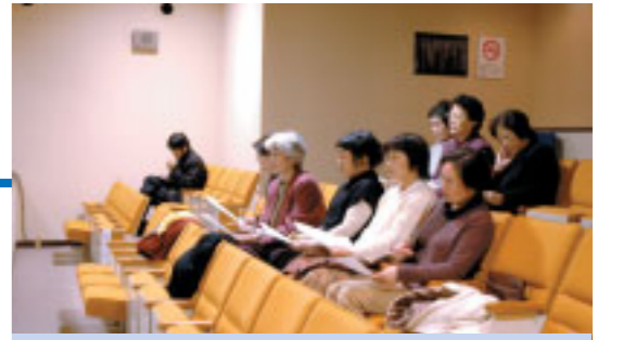
議会を傍聴する町民のみなさん

質問 町づくりと土地利用について 農用地区域の指定が、民間活力を生かした住宅地の開発などの制約になっているケースが見受けられるが、本年度策定された道路網計画や農業振興を見据えた土地利用をどのように考えているのか。