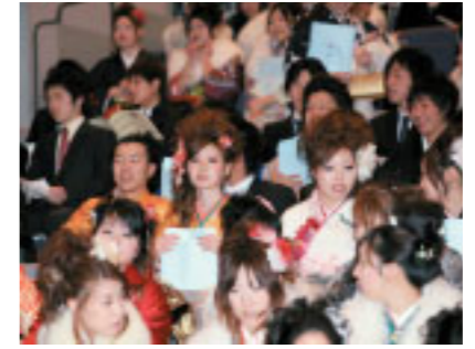
式典には、169人の新成人が出席し、大人としての自覚を新たにしました