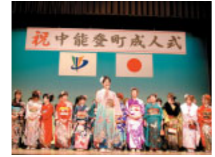
二十歳を迎えての抱負を語る場面では、未来に向かう決意が語られました