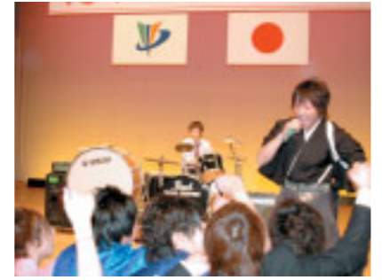
式典後の第2部「二十歳の思い出作り」は、成人者が企画立案。バンド演奏で会場を盛り上げました