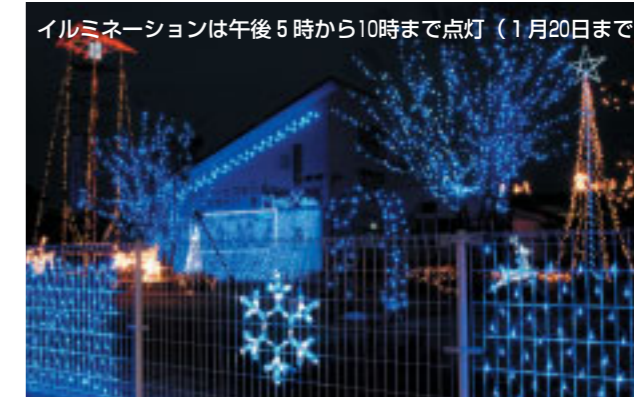
イルミネーションは午後5時から10時まで点灯（1月20日まで）

このイルミネーションは、能登部上区曳き山保存会が住民への感謝の気持ちを込めて行っているもので、今年は防火意識の高揚を目的に高さ約13mの火の見やぐらが建てられ、昨年より5千個多い3万5千個の発光ダイオードが鮮やかな光を放っています。