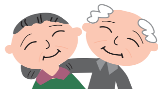
高齢者のうち、75歳以上の人を「後期高齢者」といいます

健康保険や被用者保険(※1)の医療保険に加入し「老人保健制度」による医療を受けていましたが、平成20年4月1日より、現在加入中の国民健康保険や被用者保険からはずれ、新たに「後期高齢者医療制度」に加入して医療を受けることとなります。