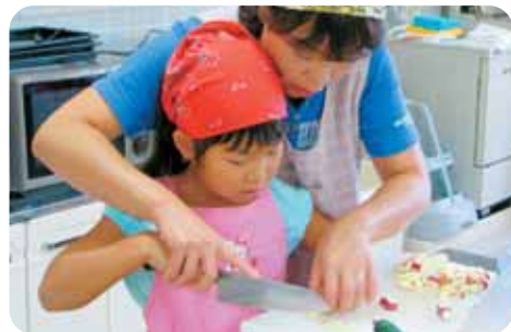
9月16日に行なわれた親子クッキング教室「さつまいもを使った料理を作ろう！」(ラビア鹿島)