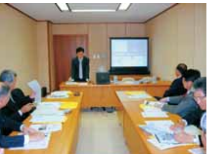
小浜市役所で「食育」を勉強