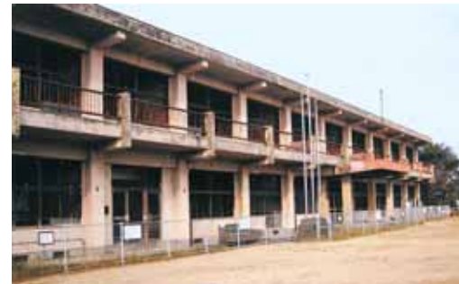
雲仙普賢岳の噴火の熱風により一瞬でガレキとなった小学校舎

福智町は、人口が2万7千人、9千世帯で、中能登町と同じく隣接地域の3町(金田町・赤池町・方城町)が合併した町で、議会議員は47人で構成。旧3町時代には、共に赤字財政再建団体に陥り、厳しい財政運営を強いられました。新たなまちづくりを目指して頑張っています。