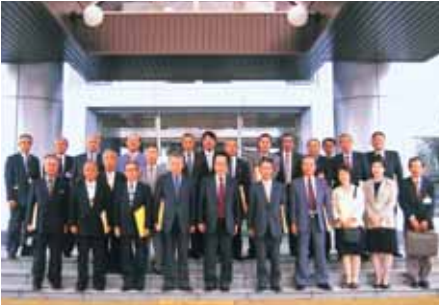
福智町役場正面玄関前

しています。今回の福智町での財政再建策での取り組みを参考に、経費節減と長期計画による安定した行財政の運営に努めなければならぬと、再認識した有意義な研修でありました。