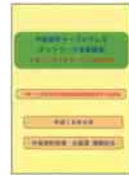
事業概要書(説明資料)