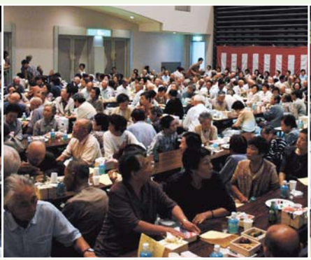
鹿島地区敬老会（ラピア鹿島）