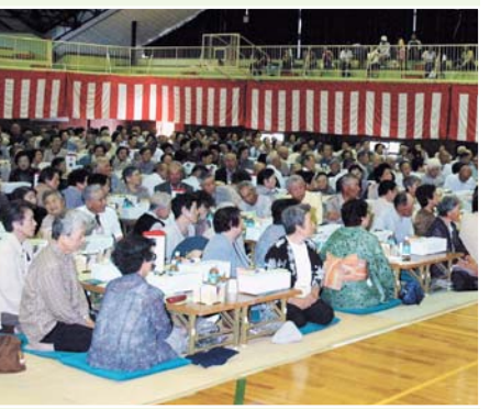
鹿西地区敬老会（励志館）