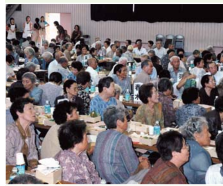
鳥屋地区敬老会（鳥屋体育館）

9月17、18日、3会場で中能登町敬老会が行われ、約1,300人が歌や踊りを楽しみました。また、同会場に金婚を迎えられたご夫婦を招待し、記念品をお贈りしました。