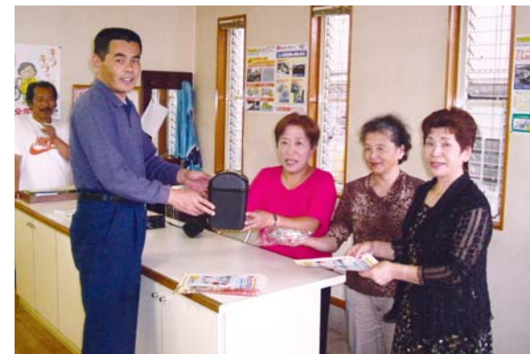
ポイ捨てをしないようゴミ箱と、居眠り運転防止のガムを鳥屋地区の事業所に配布しました。

日頃から一人ひとりが交通ルールをしっかり守り、他人への気配り・思いやりを持って運転することで、交通事故のない、安心・安全な町をつくりましょう。