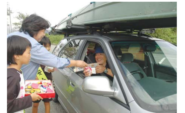
鹿島バイパスの中能登パーキング(久江)で交通安全マスコットなどを配布し、安全運転をお願いしました。