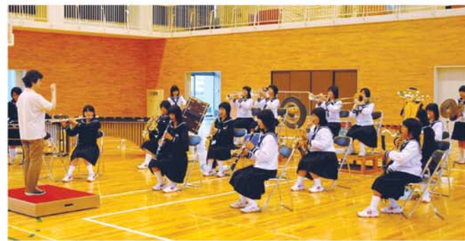
10月3日の激励会の様子

10月5日～ アルプラザ鹿島 セントラルコート ※その他、町内各地で展示を予定しています。