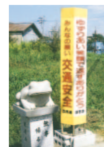
↑事故防止看板。昔田植えに使われていた木枠を再利用しています

西馬場老人クラブと西馬場健老会は、西馬場地内に6年前から設置してあった「事故防止呼びかけ看板」を更新設置し、交通安全を呼びかけました。