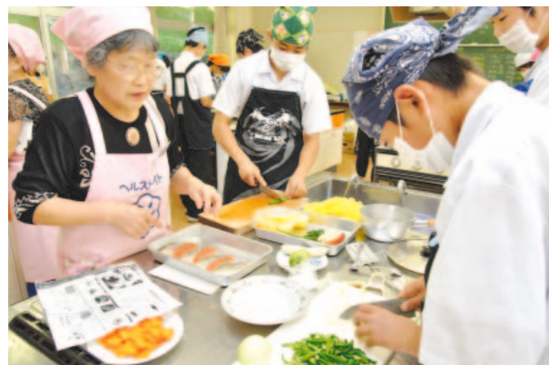
↑食生活改善推進員が見守るなか手際よく調理する生徒たち

9月17日、鳥屋中学校2年生の家庭科で、町食生活改善推進員3人の指導のもと調理実習が行われました。同推進員が「みんなで楽しく作りましょう」とあいさつした後、ムニエルなどを調理しました。料理は初めてという人もたくさんいましたが、生徒たちは、推進員のサポートを受けながら手際よく調理していました。