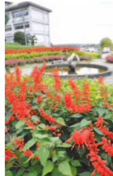
↑鹿島中の花壇。校舎裏

校舎内に広がる総面積約1,000平方メートルの花のじゅうたんは圧巻です。生徒や先生、保護者が心をこめて毎年花壇をお世話しています。