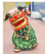
↑音や振動で踊る獅子頭