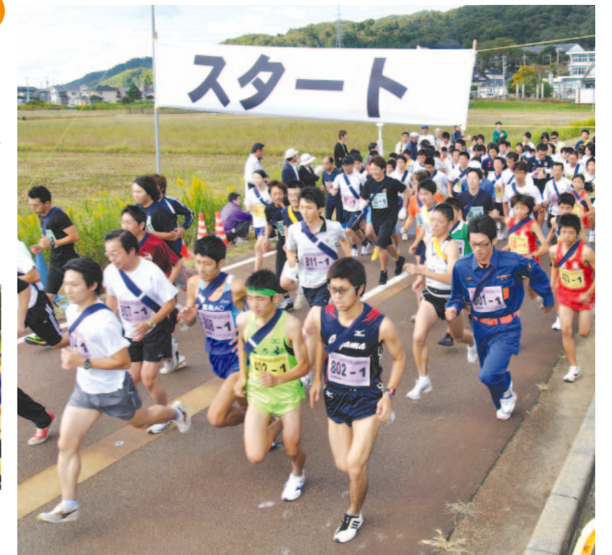
↑全106チームが一斉にスタート！全チームが無事完走しました

↑会場内では女性防火クラブによる防火キャンペーンも行われました。アンケートに答えた人に、防火クラブの手づくりマスコットをプレゼントしていました。