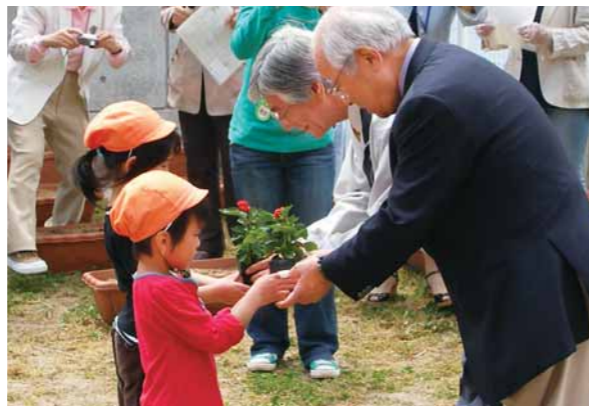
↓花苗を主催者から受け取る園児たち

→眺望満喫&新緑ウォーキング in中能登町。激しい雨のため予定していた樹形山コースは中止となりましたが、もう一つの石動山コースは挙行されました。参加者は、山頂を目指し楽しみました。