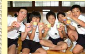
キャンドル作り(鳥屋小)

県地球温暖化防止活動推進員や町職員の協力のもと、町内の小学校でキャンドル作りを行っています(小学6年生が対象)。温暖化の現状や防止対策についての講義も同時に行われるなど、授業の一環として実施しています。作ったキャンドルは、環境省で実施しているライトダウンキャンペーン(前ページで紹介)の時期に合わせて自宅で灯し、家庭内で環境問題を考える一つのきっかけとして利用いただいています。