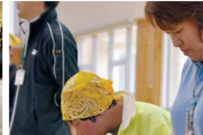
演奏に集中する「つばさ音楽クラブ」