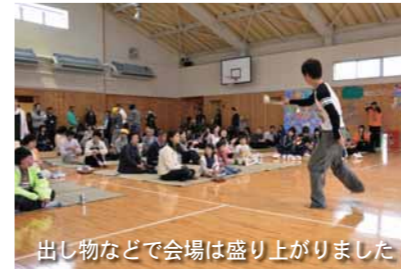
出し物などで会場は盛り上がりしました