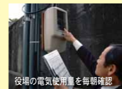
役場の電気使用量を毎朝確認

町内施設ではエネルギー使用量を毎月、役場3庁舎では電気使用量を毎日記録しています。記録した数値の変化を見ることにより、原因の究明や対策を迅速に行うことができます。また、職員一人ひとりの意識向上にもつながっています。