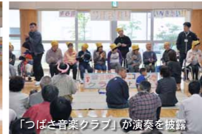
「つばさ音楽クラブ」が演奏を披露