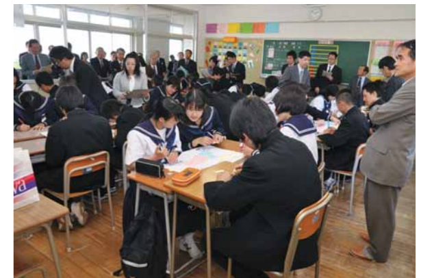
↓模擬授業を見学する関係者のみなさん