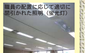
職員の配置に応じて適切に間引かれた照明(蛍光灯)

この結果に満足することなく、これからも町職員全員が一丸となって温暖化防止対策に取り組んでいきます。