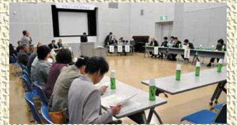
今年4月30日に開催された総会の模様

商工会で活動していた環境創造委員会(ファッションタウン推進協議会)を母体として、中能登町は平成19年11月に地球温暖化防止推進協議会(通称「なかのとエコネット」)を設立しました。当協議会は、区長会や女性連絡協議会が中心となる「家庭部会」、商工会が中心となる「事業所部会」、小・中学校が中心となる「学校部会」、役場が中心となる「行政部会」の4部会で構成されており、それぞれの部会で地球温暖化防止の活動に取り組んでいます。