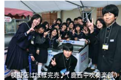
模擬店はほぼ売切(鹿西中吹奏楽部)