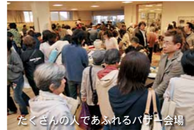
たくさんの人であふれるバザー会場