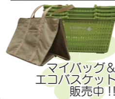
マイバッグ& エコバスケット 販売中!!