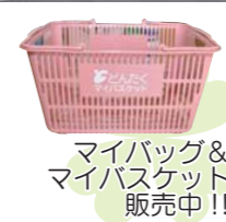
マイバッグ& マイバスケット 販売中!!

地球に優しい買い物始めませんか? 今日、地球環境問題は日ごとに深刻さを増しているといわれています。限りある資源の浪費を避け、よい環境をこれからの世代に引き継いでいくことが、わたしたちの責任です。恵み豊かな地球環境と地域の環境を守り、循環型の社会を構築するために、わたしたち一人ひとりのライフスタイルを、環境への負荷の少ない形に変えていくことが求められています。その第一歩として、「レジ袋を使わない」取り組みを始めましょう。