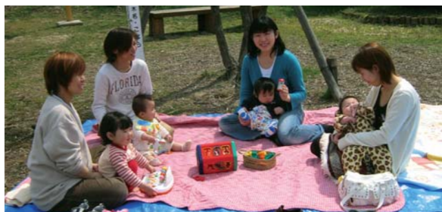
↑心地よいお日さまの下で、いい気分♪

保育園横のどんぐりコロソ広場で、「なかよし広場」 を開催しました。暖かい日差しを浴びて、おもちゃで あそんだり草花を摘んだりティータイムをとったり と、ゆったりとした時間を過ごしました。おいしい空 気を吸って、心もからだもポッカポカの「広場」タイ ムでした。