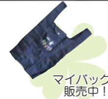
マイバッグ 販売中!!