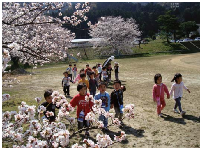
↑わぁ〜、見て!あたり一面桜でいっぱい♪