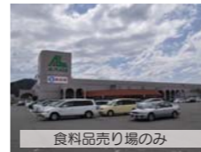
食料品売り場のみ