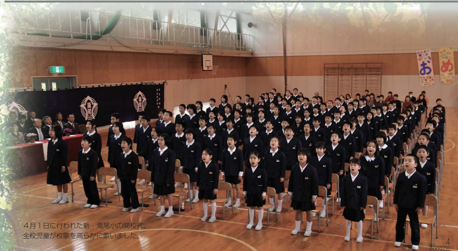
4月1日に行われた新・滝尾小の開校式。 全校児童が校歌を高らかに歌いました。