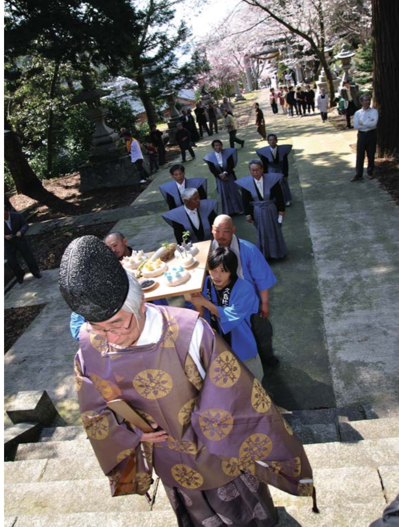
↑区の皆さんで準備したオケラ餅を祭るため、両神社の氏子が協力して運んだ