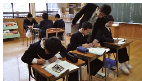
↑高学年の授業風景。久江小は複式学級であり1・2年生、3・4年生、5・6年生の3学級で授業が行われていた。先生は一人ひとり丁寧に指導を行う。