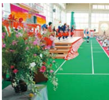
心の込もった生花

ともに笑い、ともに楽しむ。そんな素晴らしい敬老会が、ここ中能登町にはあります。ぜひ来年も敬老会へ足をお運びください。そしてまた元気なお顔を見せてください。