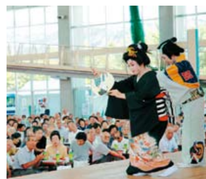
ステージ上での催し