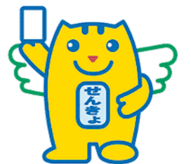
明るい選挙イメージキャラクター 「選挙のめいすいくん」

期間 11月12日(水)から15日(土)まで 時間 午前8時30分から午後8時まで 場所 中能登町役場鳥屋庁舎・鹿島庁舎・鹿西庁舎