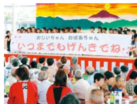
園児からの温かいメッセージ