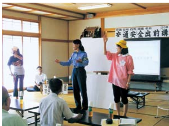
道路はみんなのもの。交通ルールを守りましょう！

8月21日、西馬場健老会の高齢者交通安全教室が、西馬場集会所で開かれ、会員約30人が参加しました。石川県警本部、石川県交通指導員らによる愉快的な寸劇や、歌いながら身体を動かす「リフレッシュ体操」などを通じて、交通ルールの遵守や振り込め詐欺被害防止の意識を高めました。