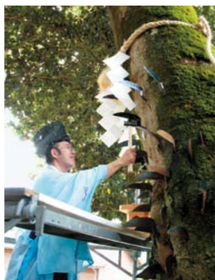
住吉神社にて。鎌の数に歴史を感じます

8月27日、県指定無形民族文化財の鎌打ち神事が住吉神社(藤井)と鎌宮諏訪神社(金丸)の2か所で行われました。「タブ」の木に左鎌(雄鎌、