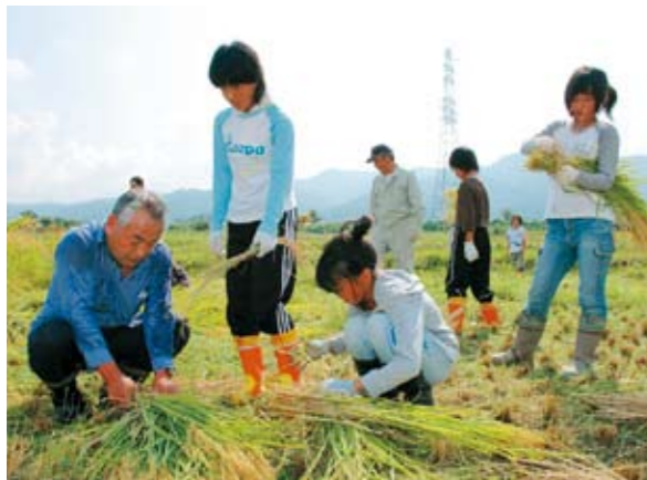
刈った稲をまとめて縛る方法を教わる児童たち

9月14日、東馬場子ども会の稲刈り体験が東馬場地区のコロニー体験農園で行われ、子どもたち約30人が収穫作業に汗を流しました。この日は朝から気温が高くとても暑い日となりましたが、子どもたちは暑さにも負けず稲刈りや「はざかけ」作業を体験し、収穫の喜びを実感しました。