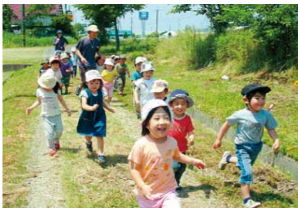
子どもたちの大好きな農道マラソン。がんばるぞ!

「ああ、おもしろかった!」「汗いっぱいかいたわ」の声に保育士もパワーをもらっています。