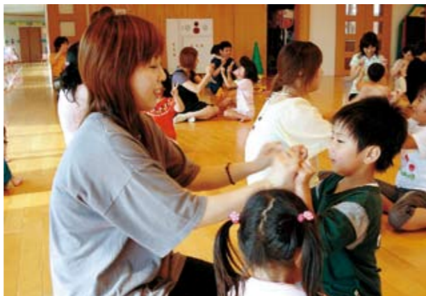
ふれあい遊び。おかあさんの手、あったかいね!