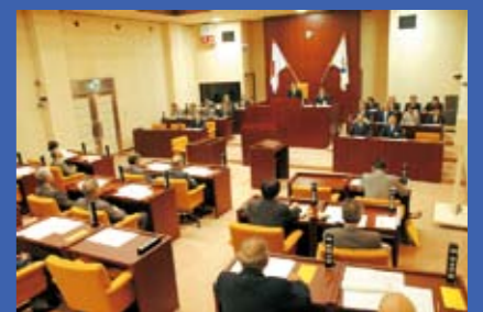
nakanoto town assembly

中能登町議会第3回定例会が、9月5日から19日までの15日間の会期で開催されました。提出された報告3件、議案13件、認定8件、請願1件、発議2件について審議され、継続審査となった認定8件、請願1件を除き、原案どおり承認、可決されました。主な内容は次のとおりです。