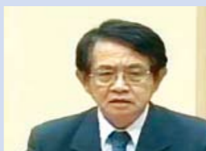
上見 健一 議員

新規施設の増加に加え、平成18年度の排出量が基準年に比べ約2%減少したことで推進体制の整備と進捗管理に甘さが出たものと反省している。現在、有識者からの助言のもと、平成22年度目標達成を目指し、私（町長）はじめ職員一同、懸命に努力しているところである。達成に向けた取組みとしては、各庁舎の電気使用量の目計をグラフ化し全職員が閲覧できるようにしている。状況を把握することにより職員の意識改革がなされつつあり、最終年度での6%削減は達成できるものと考えている。