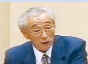
小坂 博康 議員

児童福祉法を遵守すべきことは当然だが、元気で感受性豊かな子どもたちを育てるために、必要と思われる事業については積極的に取り組んでいきたいと考えている。当町では、ゆとりある保育施設、園外活動など、最低基準とは別の視点から取り組んでいる。さらに、多様化する保育ニーズに応えるため、厳しい財政の中、効率的な運営を模索するため、指定管理者制度の導入および民営化に向けた検討が必要と考えている。今後、次代を担う子どもたちの育成に努めたい。