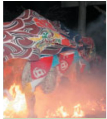
獅子も駆け抜ける