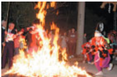
勇猛果敢に炎に立ち向かうこどもたち

燃えさかる炎の中をみこしや獅子舞が次々と駆け抜ける光景はまさに圧巻。途中、子どもたちが駆け抜けようとしたとき炎の勢いがピークに達しましたが、