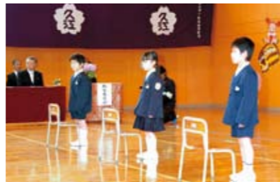
歓迎の歌に耳を傾ける新入生