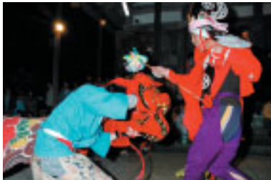
躍動感あふれる獅子舞演舞

4月20日に行われた能登部下区の春祭りでは、集めた厄を焼き払う火渡りが行われました。