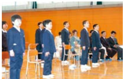
歓迎の歌で温かく迎える在校生