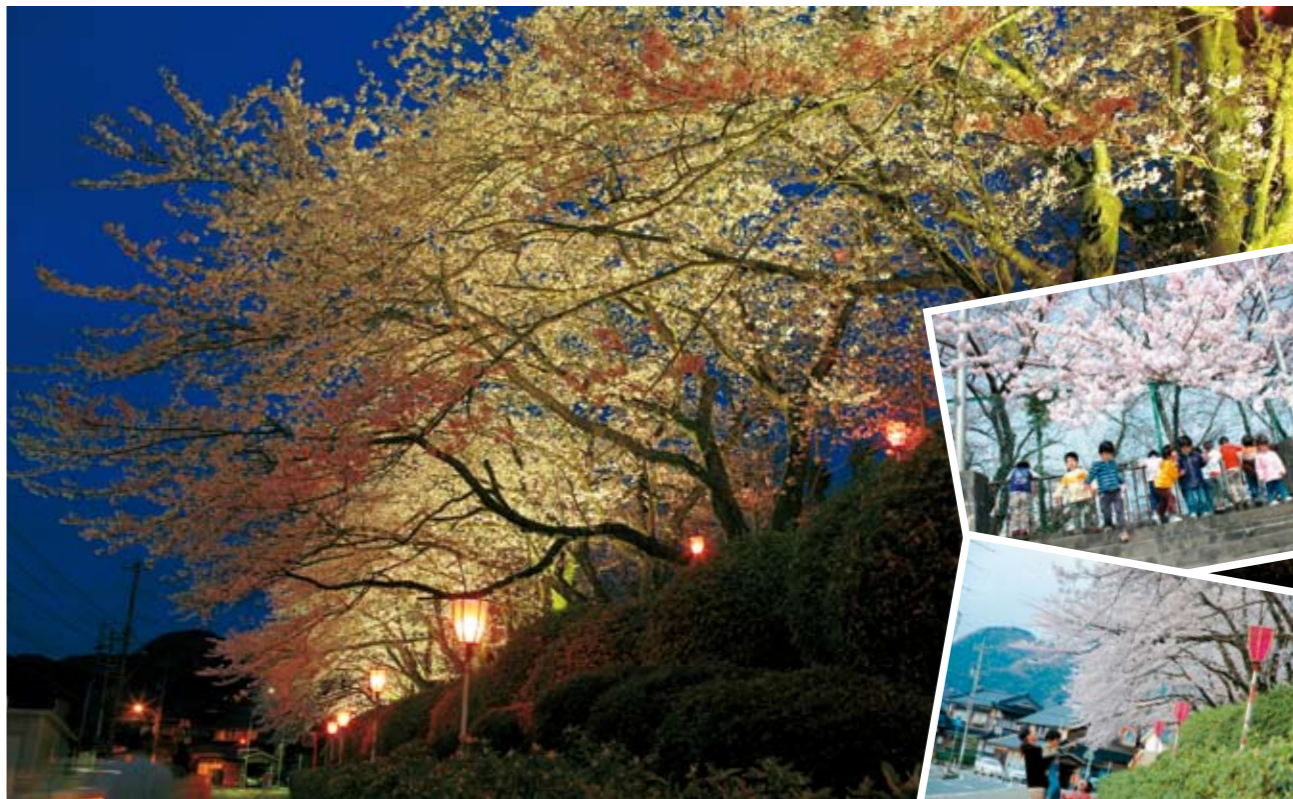
102本の桜が大きく枝葉を伸ばす鹿島中学校前