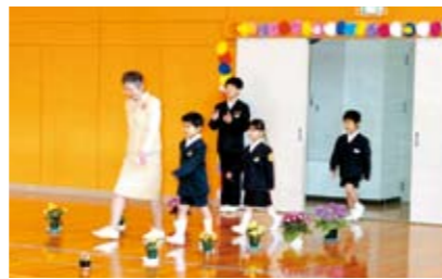
ドキドキわくわくしながら入場!