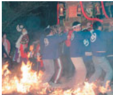
みこしを担ぎ、いざ炎の中へ!