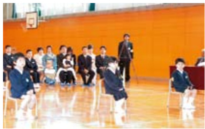
少し緊張気味の新入生たち